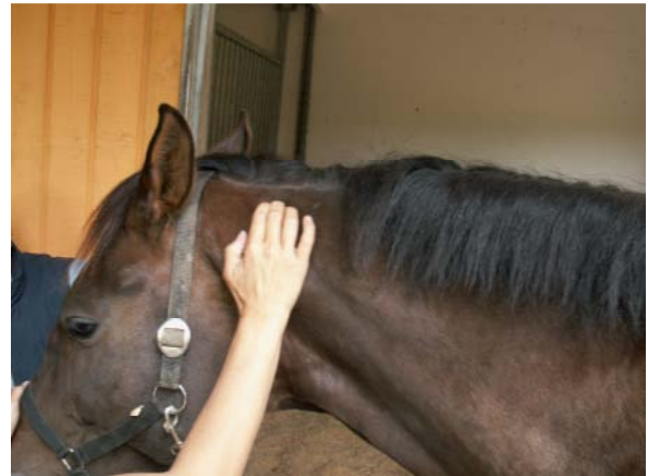
Brachiocephalicus og splenius udspring over C1-2