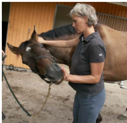
C1-C2 ekstension og rotation