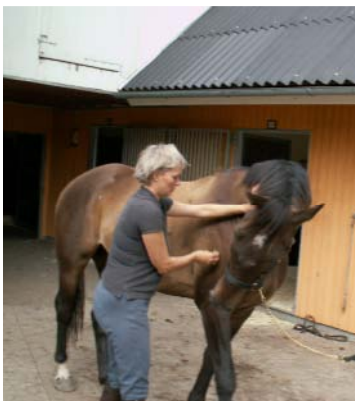
Lateralflexion og rotation af de øverste nakkehvirvler