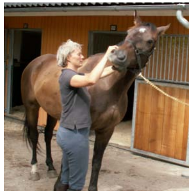
C1-C2 fleksion og rotation