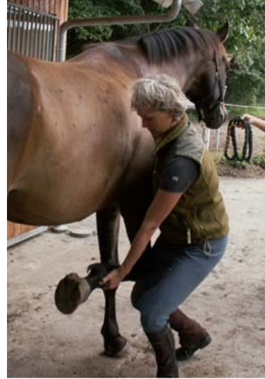
retraktion af skulderen