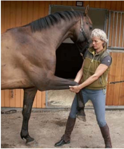
protraktion af skulderen