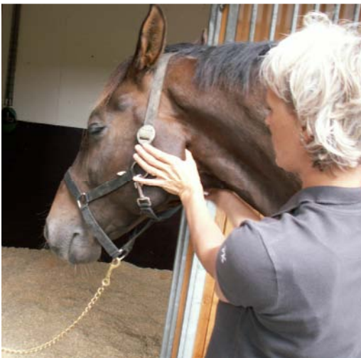
MFR eller udspænding omohyoide muskler