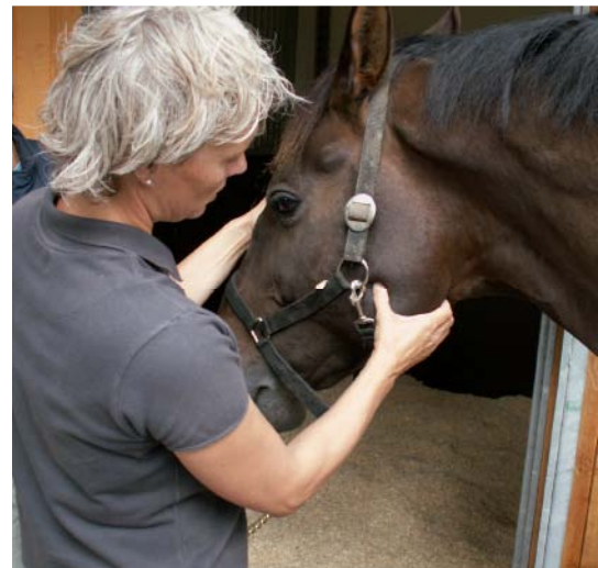
MFR eller udspænding tyggemusklerne