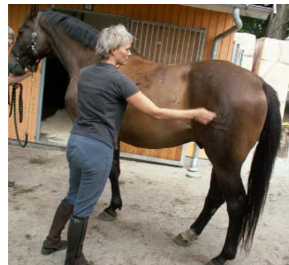
Thoracolumbal felksion og hø.sidig lateralfleksion