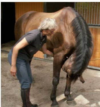
Udspænding lig. nuchae