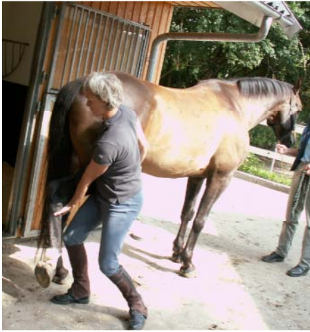
Hoftens fleksorer skub