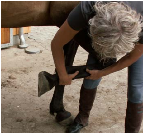
Mobilisering dybe bøjesener