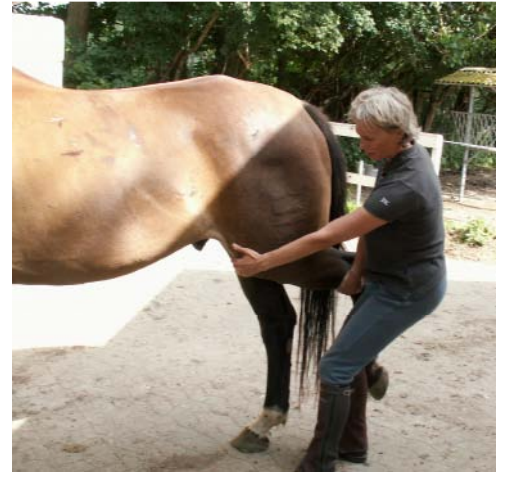
Hoftens fleksorer træk