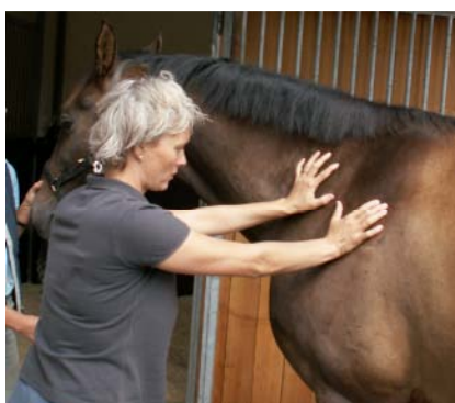
MFR fascien foran scapula